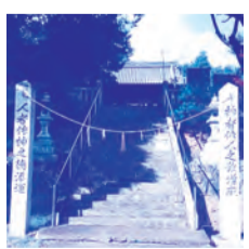
(東広島市重要文化財として指定)

融資限度額:日本政策金融公庫の各融資制度限度額に6,000万円を加えた額 返済期間:設備資金20年以内(据置5年以内)運転15年以内(据置5年以内) 金利:基準金利マイナス0.9%(3,000万円以内、被災証明等有り、当初3年間)基準金利マイナス0.5%(被災証明等有り、3年経過後)または「被災証明有り、3,000万円超」前記以外は各融資制度に定められた利率 ※詳しくは日本政策金融公庫HP等で確認ください。